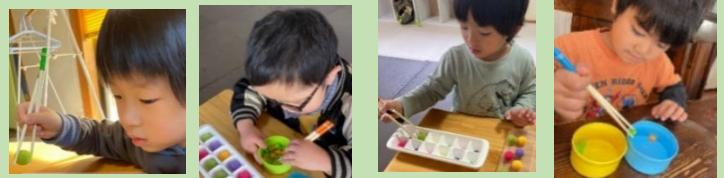
回内握り 回外握り 三指握り 三指握り

スプーンやフォークを鉛筆握り（三指握り）で握れるようになると、やがてお箸を正しく持つことに繋がります。さんぽでは食事の時間や、机上課題、午後療育を通してお箸の練習をしています。まずは正しい持ち方でお箸を持ち、次に開いて・閉じてと箸を動かし、さらに物を掴んで、離すなど一つひとつ段階を追いながら取り組んでいます。練習にとらわれすぎてしまうと箸を使う事が苦痛になってしまうので、楽しみながら進めていく事がポイントです。👉エジソン箸や補助具などのトレーニング箸が使われている方もいらっしゃると思いますが、実際にお箸を使う場合に、使う筋力の位置が通常の箸を使う際と異なる場合もありますので、補助箸からお箸に移行する際に、戸惑うお子さんもいらっしゃいます。正しく持てるようになるためには、急がず、丁寧な支援が必要です。ご家庭でもお子さんのお箸の持ち方を一緒に確認してみられてくださいね😊始めは、一本のお箸を親指・人差し指・中指の三本で持ち、お箸だけを動かす練習をすると効果的です♪